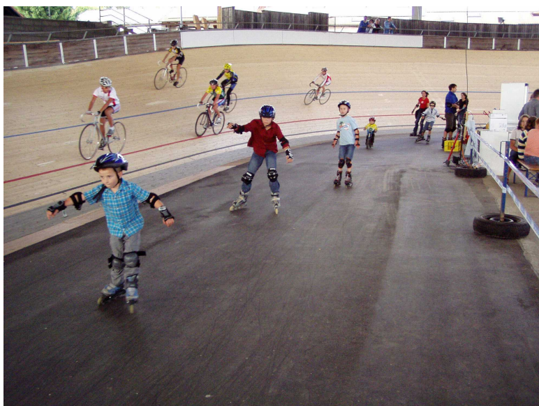
Rennbahnhocketse am 15. September 2007

Im letzten Brief konnte ich Sie zur Rennbahnhocketse einladen. Es war ein gelungenes Fest. Alle kamen auf ihre Kosten. Neben Speis und Trank gab es allerlei Unterhaltung. Auf der fertigen Bahn wurden die ersten Rennen gefahren. Auf dem Asphaltbelag konnten die Besucher mit dem Rad oder auf Inlinern ihre Runden drehen. Unsere Kunst- und Einradfahrerinnen zeigten ihr Können.